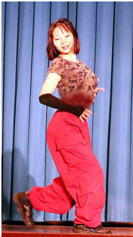
個人パフォーマンス ダンス「Vengeance」「紋白蝶」「ワンドリンク別」