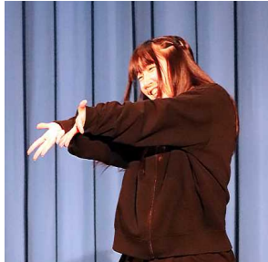
ダンス 「可愛くなれたらいいのに」