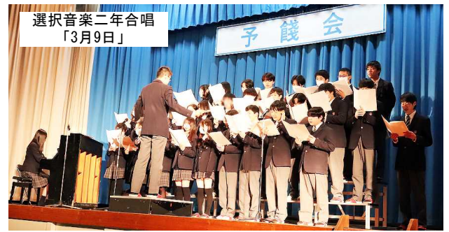
選択音楽二年合唱 「3月9日」