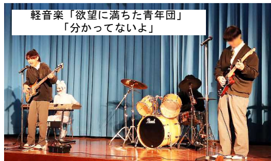
軽音楽「欲望に満ちた青年団」 「分かってないよ」