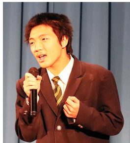
歌「高嶺の花子さん」