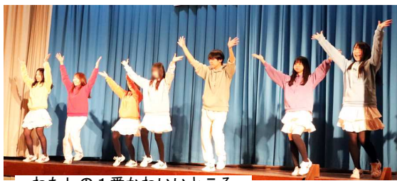
わたしの1番かわいいところ