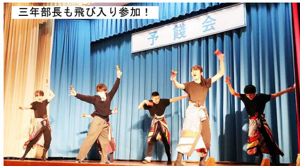
三年部長も飛び入り参加！