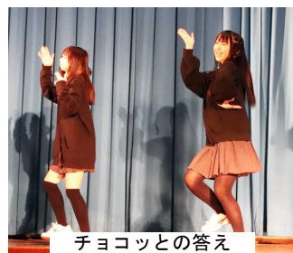
チョコットの答え