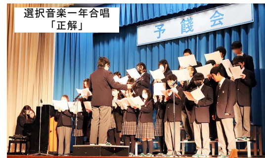
選択音楽一年合唱 「正解」