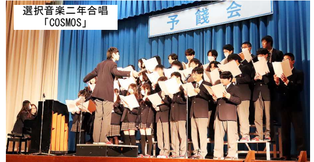
選択音楽二年合唱 「COSMOS」

一、二年生だけで初めて構成した部活動の発表や三年生も飛び入り参加の部活。個人パフォーマンスに出演した三年生の完成度の高い演技や演奏は、これで見納めなのかと思い知らされました。そして会場は、卒業生の、在校生の「感謝」の気持ちで溢れました。また代表の挨拶では、卒業生と在校生の絆の強さが語られました。アーチを作って三年生を送り出す一、二年生。この高校生活での出逢いに心から感謝したいと思います。