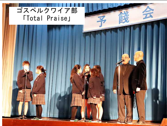
ゴスペルクワイア部 「Total Praise」