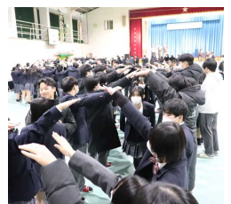
よさこい・ソーラン部 「ソーラン節」 「福の神」「黒田節」