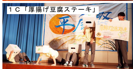
1C「厚揚げ豆腐ステーキ」