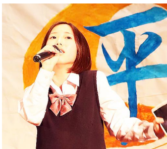
個人パフォーマンス・左上から3D「さよならエレジー」 2D「SOUL SOUP」・3A「歌よ」「U」