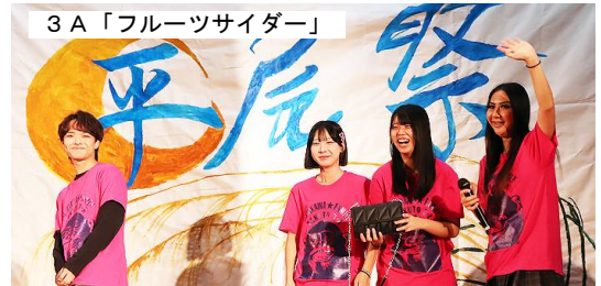
3A「フルーツサイダー」