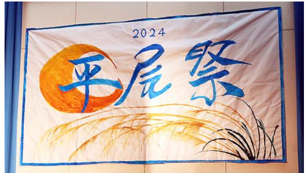
平尾祭ステージ看板披露・各クラス文化委員を中心に作成

私にとって高校生活最後になった平尾祭は、模擬店の準備やステージ発表の司会などの経験によって、とても楽しいものになりました。仰星学園高校の生徒会長としてこのような素晴らしい平尾祭を残すことができたことが、本当に最高の思い出です！