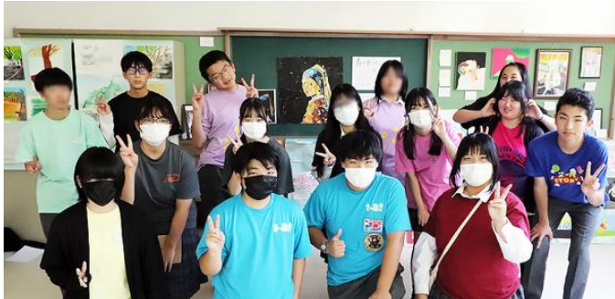
本館展示会場の様子と共同作品を展示した美術部の皆さん