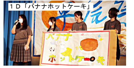
1D「バナナホットケーキ」