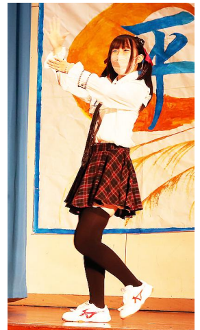
個人パフォーマンス 2C