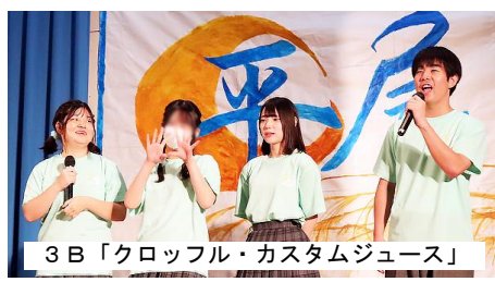
3B「クロップル・カスタムジュース」