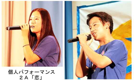
個人パフォーマンス 2A「恋」 応援する担任と生徒

ステージ発表の昨年との違いは、スマブラ王者決定戦です。私や知らない人にとってはあまり盛り上がらないと思っていましたが、実際は想像以上に盛り上がって、観戦しているこっち側も見ているだけで楽しくて印象に残っています。来年も同じように模擬店ができるなら今年よりも良いものを提供できるようにがんばりたいです。