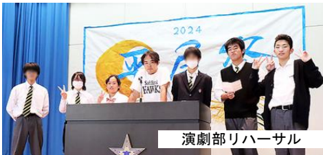
演劇部リハーサル