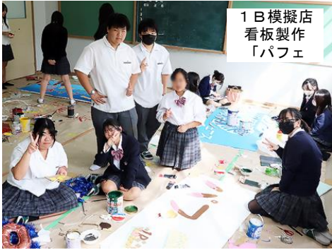
1 B 模擬店 看板製作 「パフェ」