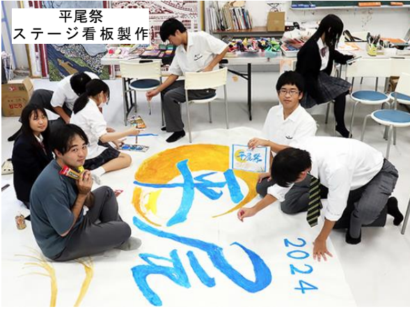
平尾祭 ステージ看板製作