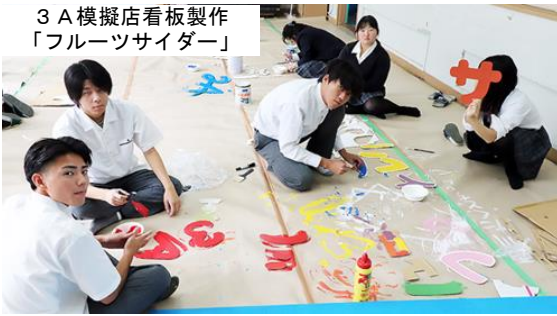
3 A 模擬店看板製作 「フルーツサイダー」