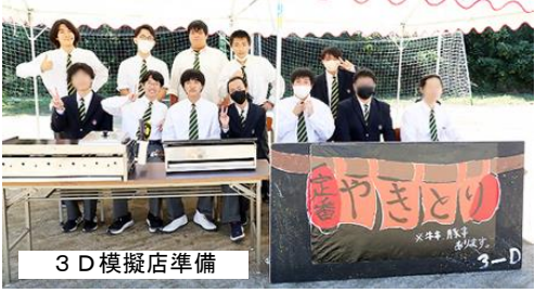
3 D 模擬店準備