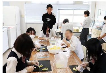
3A模擬店準備 「フルーツサイダー」