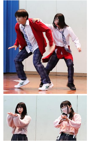
ダンス部リハーサル