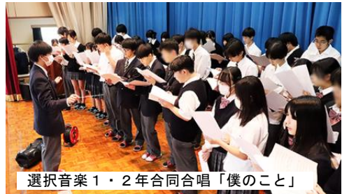
選択音楽1・2年合同合唱「僕のこと」