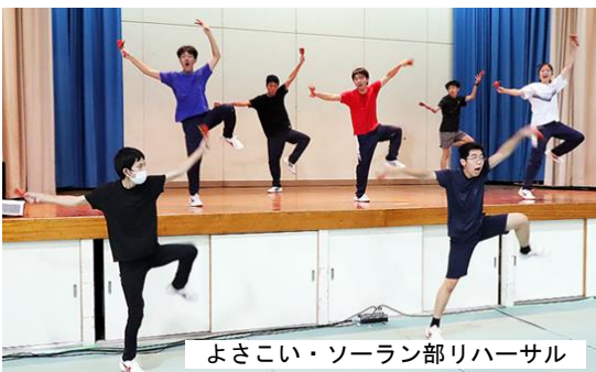
よさこい・ソーラン部リハーサル