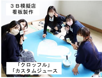
3 B 模擬店 看板製作