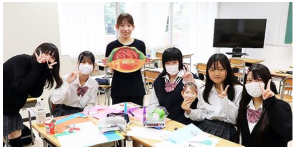
2A模擬店看板製作 「サンドイッチ」