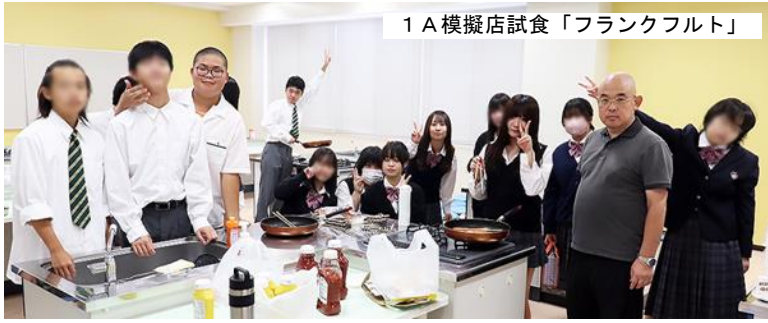
1 A 模擬店試食「フランクフルト」