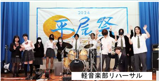
軽音楽部リハーサル