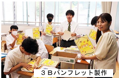
3Bパンフレット制作