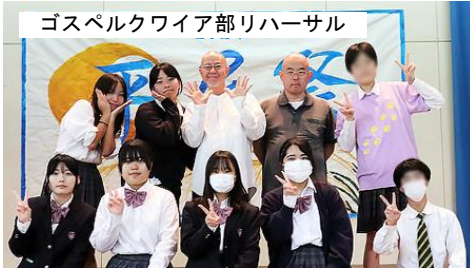
ゴスペルクワイア部リハーサル