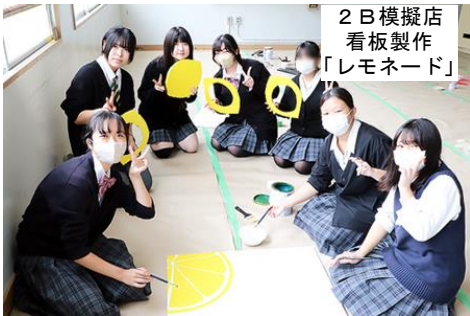
2 B 模擬店 看板製作 「レモネード」