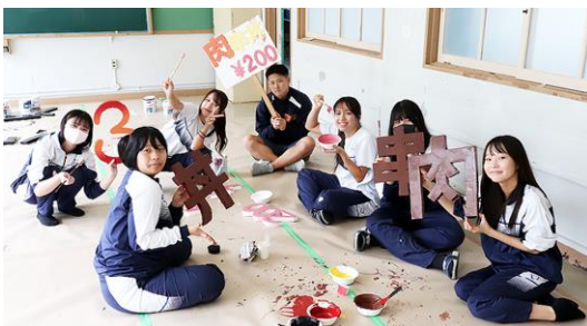
3C模擬店看板製作 「肉串・肉丼」