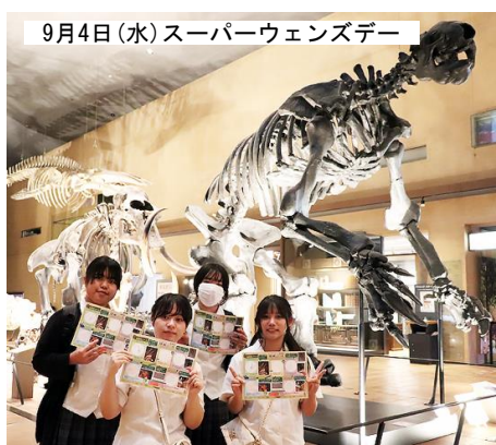
9月4日(水)スーパーウェンズデー