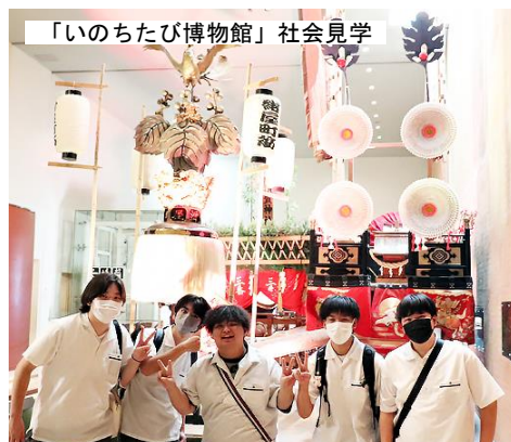
「いのちたび博物館」社会見学