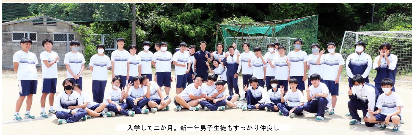
入学して二か月。新一年男子生徒もすっかり仲良し