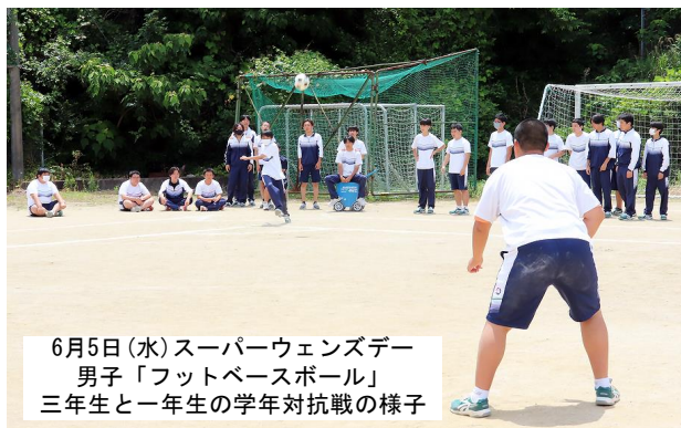
6月5日(水)スーパーウェンズデー 男子「フットベースボール」 三年生と一年生の学年対抗戦の様子

あります。毎週水曜日に行われる本校伝統イベント、仰星学園全力企画「スーパーウェンズデー」です。この企画は、クラスマッチ、皿倉山ハイク、グリーンパーク、ボーリング、映画鑑賞、スケート、バスハイクなど、教室では得られない体験的な学習を行い、生徒の皆さんはクラスや学年の垣根を越えて沢山の人と交流を深めることができます。(次頁へ)