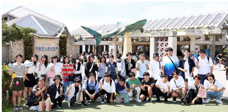
6月27日(木)修学旅行四日目美ら海水族館にて3年D組の皆さん

4泊5日の修学旅行を終えた解散式。福岡空港からのバスを降り学食に集まった三年生の姿から、達成感、満足感、高揚感を感じました。梅雨明け宣言した沖縄県の熱気をそのまま持って帰ってきたような熱量。そして何よりも集団で生活したことから生まれる、一回りも二回りも成長した姿に感動しました。