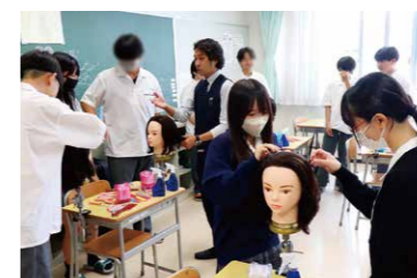
全校生徒対象の進路ガイダンスの様子。