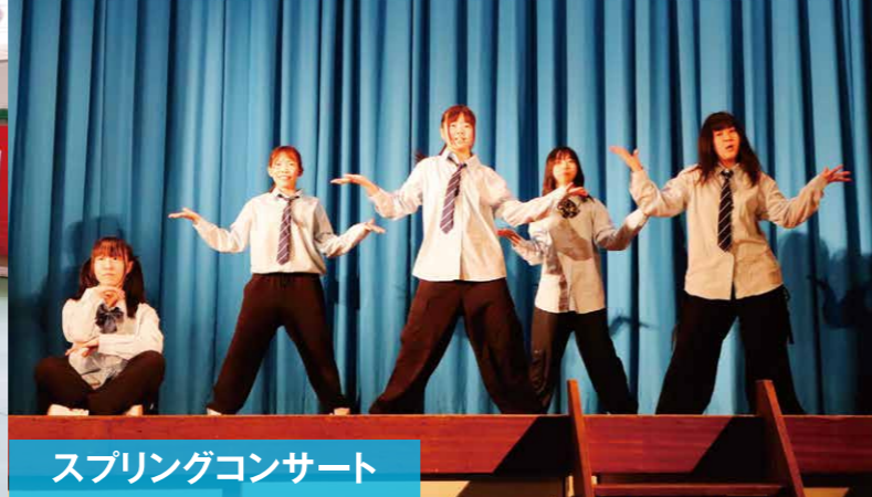
スプリングコンサート