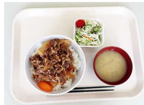
【左】週替わりAランチ「煮込みハンバーグ」330円 【右】週替わりBランチ「牛丼」330円