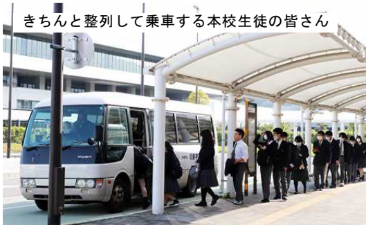
きちんと整列して乗車する本校生徒の皆さん