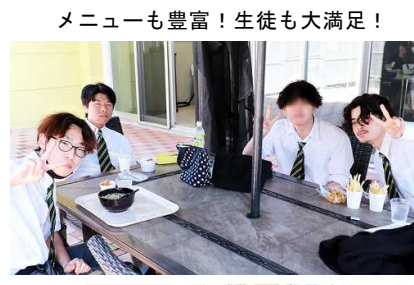
メニューも豊富！生徒も大満足！