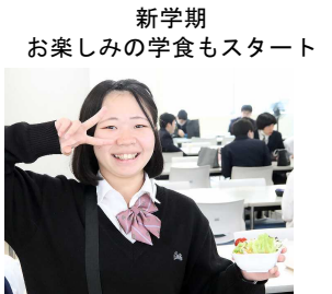
新学期 お楽しみの学食もスタート