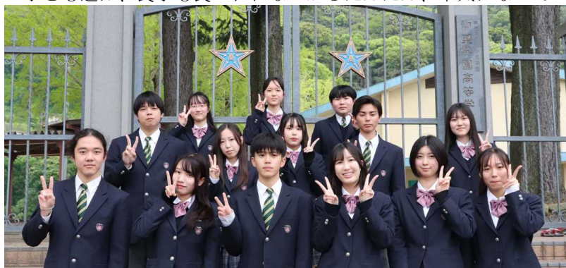
4月16日(火)生徒会役員に任命された生徒会執行部の皆さん