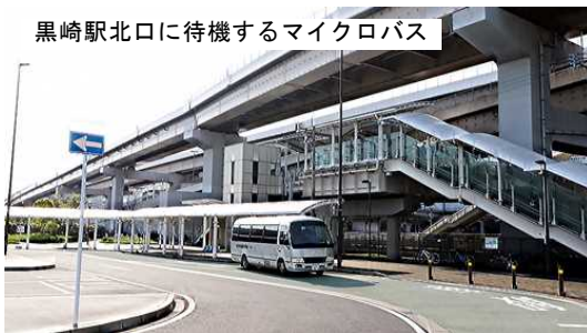
黒崎駅北口に待機するマイクロバス

本校には、生徒の皆さんをいつも真剣に考え、動く先生方がいます。今日から、本校の先生方と生徒の皆さんがスクラムを組み、一丸となり、新たな挑戦を始めます。君たちの素晴らしい力を信じています。新入生の皆さんの活躍を、心から楽しみにしています。今日の入学式を迎えた晴れやかな気持ちと大きな決意を胸に、今日の日の喜びと感謝の気持ちを忘れずに、楽しく充実した高校生活を送り、本校での学校生活が将来にとって大きな財産になることを期待しています。